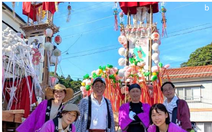
過去の能登復興ボランティア活動の様子：(a) 1回目 2024年11月輪島市名舟町/土砂の撤去作業、(b) 2回目 2025年7月真脇地区/真脇キリコ祭の準備・運行サポート