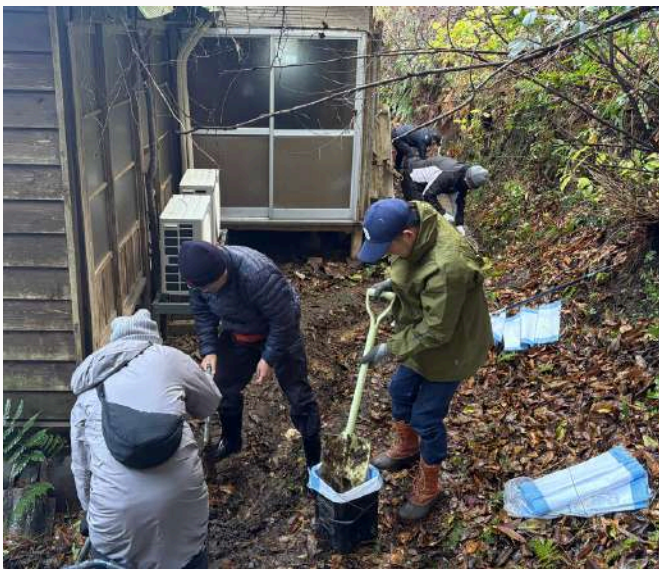
前日に雪が降ったものの、当日は見事に晴れて捗った作業の様子

復興までの道のりは決して平坦ではありません。解体作業や住まいの整備、地域での合意形成、制度面での調整など、外からは見えにくい工程を一つひとつ丁寧に進めながら、能登地域の皆さんが日々の生活と向き合い、暮らしの再建に向けた歩みを着実に重ねていることを、今回の活動を通して知ることができました。